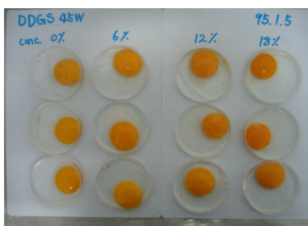
【圖二】添加含可溶物乾燥玉米酒粕對菜鴨蛋黃顏色的影響。

產蛋菜鴨在產蛋前期 (20 週齡) 所產的蛋在蛋黃脂肪含量方面比後期所產的蛋低 (表八,九,十,十一)。採食添加含可溶物乾燥玉米酒粕飼糧的菜鴨所產的蛋黃脂肪含量有比對照組高的趨勢, 尤其在產蛋後期特別顯著 (表十一); 50 週齡時 12% 和 18% DDGS 兩組的蛋黃脂肪含量顯著的增加, 而且 18% DDGS 組的蛋黃膽固醇也顯著地高於對照組 (表十一)。但是飼糧添加含可溶物乾燥玉米酒粕對蛋黃膽固醇含量的影響在各階段所得到的結果並不一致, 所以無法由本試驗的數據得到具體的結論。產蛋菜鴨飼糧使用 12 或 18% 的含可溶物乾燥玉米酒粕在整個產蛋期都發現可以顯著地增加蛋黃的亞麻油酸 (linoleic acid C18:2) 的比例, 但是對其它的脂肪酸的比例則沒有一致的結果。含可溶物乾燥玉米酒粕的脂肪含有大量的不飽和脂肪酸, 其中亞麻油酸 (C18:2) 的比例高達 56% (Schingoethe, et al., 1999), 因此, 在蛋鴨飼糧使用含可溶物乾燥玉米酒粕會改變蛋黃的脂肪酸組成是很合理的。亞麻油酸是人體重要的必需脂肪酸之一, 因此添加含可溶物乾燥玉米酒粕有助於提升鴨蛋的營養價值。